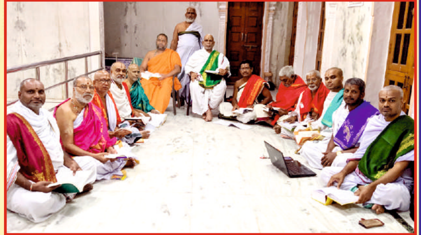
శ్రీ పాదులవారి ఆజ్ఞానుసారము శ్రీ మఠము శిష్యులకు మరియు పంచాంగరీత్యా అనుష్ఠానము చేయువారికి మాత్రమే ఉచితముగా ఇవ్వబడును. అమ్మకమునకు అవకాశములేదు.