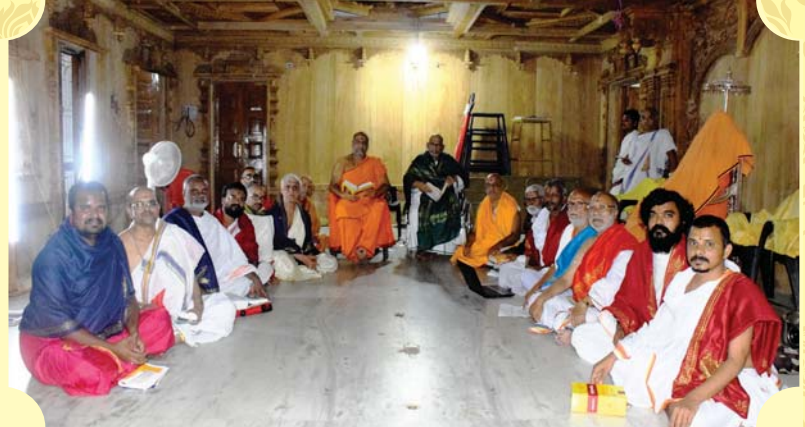
శ్రీశ్రీపాదులవారి ఆజ్ఞానుసారము శ్రీమఠము శిష్యులకు మరియు పంచాంగరీత్యా అనుష్ఠానము చేయువారికి మాత్రమే ఉచితముగా ఇవ్వబడును. అమ్మకమునకు అవకాశము లేదు.

ఇందలి నిర్ణయములు ముద్రణాదిదోషములతో తప్పులుగా పడినచో పత్రికల ద్వారా సరిదిద్ది ప్రకటింపబడును.