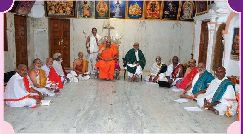
శ్రీశ్రీపాదులవారి ఆజ్ఞానుసారము శ్రీమఠము శిష్యులకు మరియు పంచాంగరీత్యా అనుష్ఠానము చేయువారికి మాత్రమే ఉచితముగా ఇవ్వబడును. అమ్మకమునకు అవకాశము లేదు.

ఇందలి నిర్ణయములు ముద్రణాదిదోషములతో తప్పులుగా పడినచో పత్రికల ద్వారా సరిదిద్ది ప్రకటింపబడును.